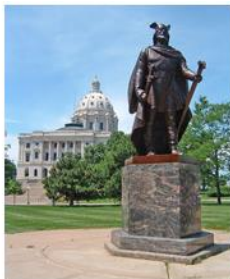
Лейв Эриксон (Счастливый)

Подпишите на карте названия океанов, которые омывают берега материка, названного вами.