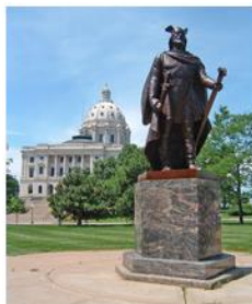
Лейв Эриксон (Счастливый)